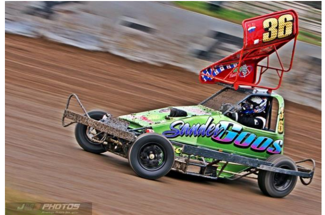
#36 Sander Goos, 2 jaar op rij baankampioen in de Formule 2 junioren.

Het baanrecord werd dit jaar ook weer verbeterd. Niemand minder dan Formule 2 stockcar rijder #124 Wim Peeters uit Nijmegen zette een ronde neer van 14.681 sec en wel in ronde 12 van heat 3 op 22 augustus dit jaar.