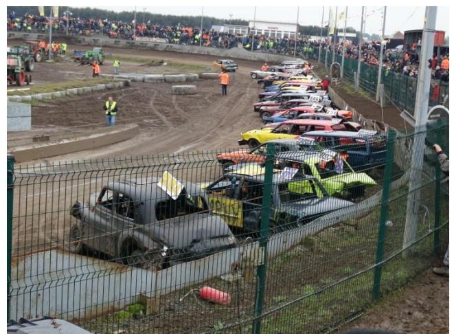
"Le Mans"opstelling voor de start vvan de Blue Oyster Tropy.

Na de heats en consolations met in totaal 170+ cars werd de opstelling gemaakt voor de Blue Oyster Trophy. #67 Marcel de Bruin mocht zich na deze spectaculaire race tot Blue Oyster winner 2015 benoemen.