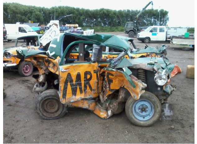
Dit blijft er over van een Ford Consul, bestuurd door #312 Sybo 'mr.-T-Bone' Huizenga