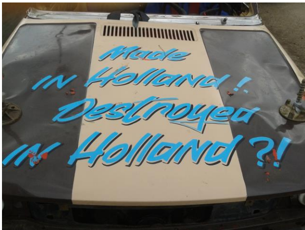
Deze uitspraak is waarheid geworden.

De wedstrijden zullen aanvangen om 12:00u Locatie: Veenakkers 35, 7881 XA Emmer Compascuum.