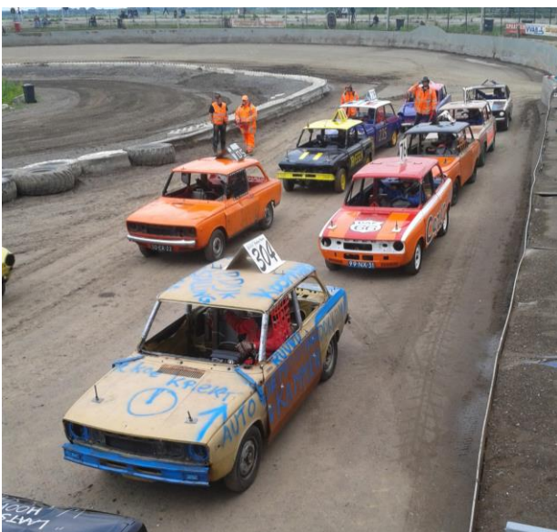
Opstellen voor de DAF races.

Met bijna 50 Dafjes waaronder Daf 33 (2x), Daf 44 (2x) en Daf 46 (1x) werd een waar spektakel op de baan gebracht. Met een kleine springschans aan de overzijde van de baan konden nog extra bonuspunten verdiend worden als men er overheen reed. Sommigen deden het erom en vlogen er overheen en zorgde voor groot genot onder het aanwezige publiek.