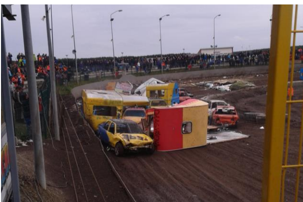
.....Einde van de caravanrace

Het was dus weer een waar spektakel bij Speedway Emmen waarbij "terug in de tijd" het motto was.